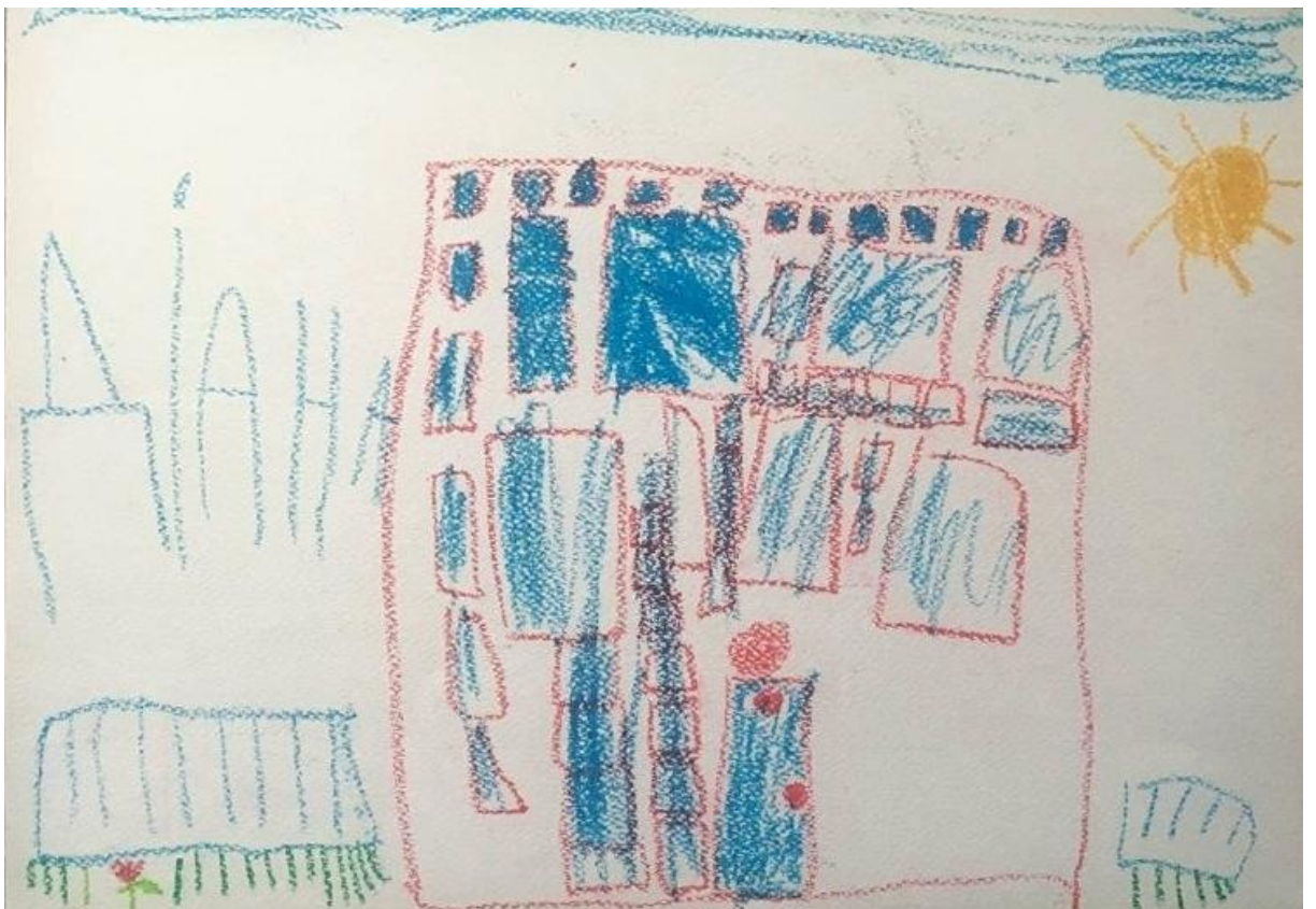
Мал.3. «Мої почуття», дівчинка, 10 років, Синдром Дауна.