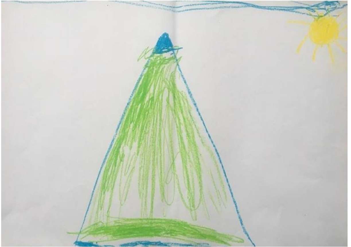
Мал.2. «Я», дівчинка, 10 років, Синдром Дауна.